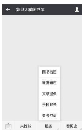
图 2：复旦大学图书馆公众号自定义菜单

“看历史”功能包括两部分：查看历史信息，以及移动图书馆帮助。查看历史可以看之前微信公众号发布的信息，而移动图书馆即移动设备与学生进行绑定，方便在移动设备上进行图书的预订等活动。