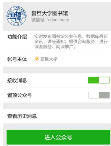
图 1：复旦大学图书馆公众号

图书馆微信公众号的功能应该与图书馆所能提供的服务相适应。复旦大型图书馆微信公众号作为本校图书馆的微信公众号，其定位是提供图书馆的各类最新资讯和活动信息的平台。复旦大学图书馆公众号功能包括：实时发布图书馆公共信息、数据库最新资讯、讲座通知；提供咨询服务；进行读者服务、阅读推广。