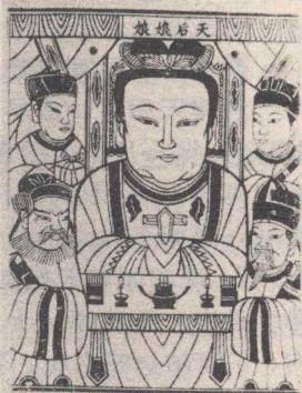
图 42 朱仙镇妈祖神像 中国历史博物馆藏

其实，妈祖供奉不限于沿海，在安徽、江西等地也有之。《陔余丛考》卷三五：“江汉间操舟者，率奉天妃，而海上尤甚”。《古今图书集成·神异典二八》引《金台纪闻》“天妃宫”，江淮间滨海多有之，《清朝文献通考·碑祀考》二引全祖望《天妃庙记》：“今世浙中、闽中、粤中以及吴淞近海之区，皆有天妃庙。”《破除迷信全书》卷十：“凡靠海的地方，以及江河码头，莫不有天妃庙”。据最近的调查表明，在江西省的九江，景德镇，安徽的宿松，湖南的芷江，江苏的南京，以致贵州的镇远等地，虽属内陆地区，距福建较远，也都有天妃庙或供奉天妃的历史。