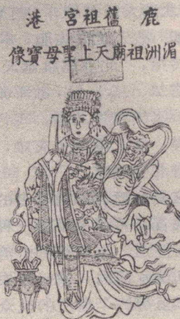
图 43 鹿港供的妈祖像

该庙建于康熙三十年，起初是一座小茅屋，康熙三十九年改建，雍正八年重建，光绪三十二年嘉义大地震，庙塌，光绪三十四年重修。由于该庙占有财产多、名声大、在台湾有重要地位。每年三月二十二日要抬妈祖绕境。各户房门大开，迎神求吉，居民、商店、机关都往神輿上掷鞭炮，烟火弥漫，药味熏人，药店大售口罩，但当地居民嘻笑自若，习以为常。三月二十三甲妈祖回娘家，使北港朝天宫庙会达到高峰。庙前有龙门虎门，正殿供妈祖像，后殿供其父母。大甲镇妈祖