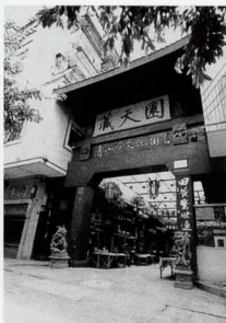
“藏天园”寿山石雕一条街

福州雕刻工艺品总厂的前身是福州雕刻厂，于1980年10月正式更名，下设福州石雕厂、福州木雕厂、福州牙雕厂3个分厂和一个研究机构——福州雕刻研究所，配置专业技术人员数十人。1986年4月，又成立了福建雕刻艺术中心。20世纪80年代后期至90年代初期，该厂先后与香港长城宝石厂和香港华榕集团合资兴办了福州长城宝石厂和