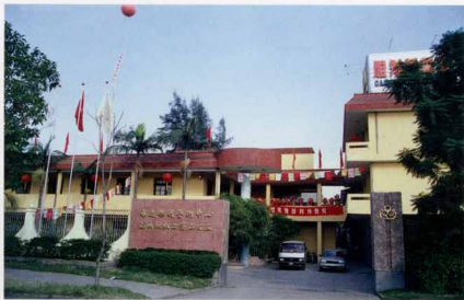
福州市石雕工艺品总厂

据1933年出版的《福州便览》一书的统计数字表明，当时，福州城内光刻字图章店就有24家，分别是鼓西路的“余临书”、“绣梓轩”、“陈良辅”，仓前路的“锦章”、上藤路的“才灯”，舍人巷的“文隆”、“成章”，延平路的“庆昌”，上杭路的“集奇文”、“陈健章”、“观章”、“陈焕章”、“开天”、“文明字”，宣政路的“王成文”、“聚同文”、“简而文”、“王文光”、“雪鸿庐”，东街“鸣华”、“焕文”、“珍藏轩”，南后路的“吴玉田”，省府路的“陈寿柏”，南街双门前的“汉庆昌”等。这些图章店经营的主要内容之一，就是寿山石的印章雕刻。由此可见，当时经营寿山石雕的商号，已遍布榕城的大街小巷。这些商号大多雇有能工