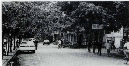
福州寿山石古董街新貌

专营寿山石的商号除了“青芝田”之外，还有许多老字号，这些老字号汇聚在一起，形成了